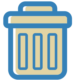
Jetez vos mouchoirs